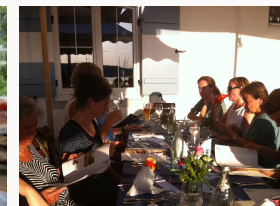
Abendsonne im Gasthof