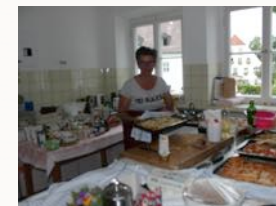
Klosterküche mit der Köchin und dem Blick auf den See

Meine Köchin wird uns in der alten Schulküche mit Blick auf den Chiemsee mit vegetarischer Kost unter der leichten Mithilfe der Kursteilnehmer versorgen.