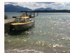
kleine Boote der Insulaner (=Einheimische)

SCHÜLER/ STUDENTEN BEZAHLEN IM MEHRBETTZIMMER 25 € .