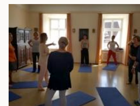
Unterricht im Konferenzzimmer

Der Unterricht wird im alten Musiksaal, Konferenzzimmer, der Turnhalle am See oder einem anderen Seminarraum statt finden.